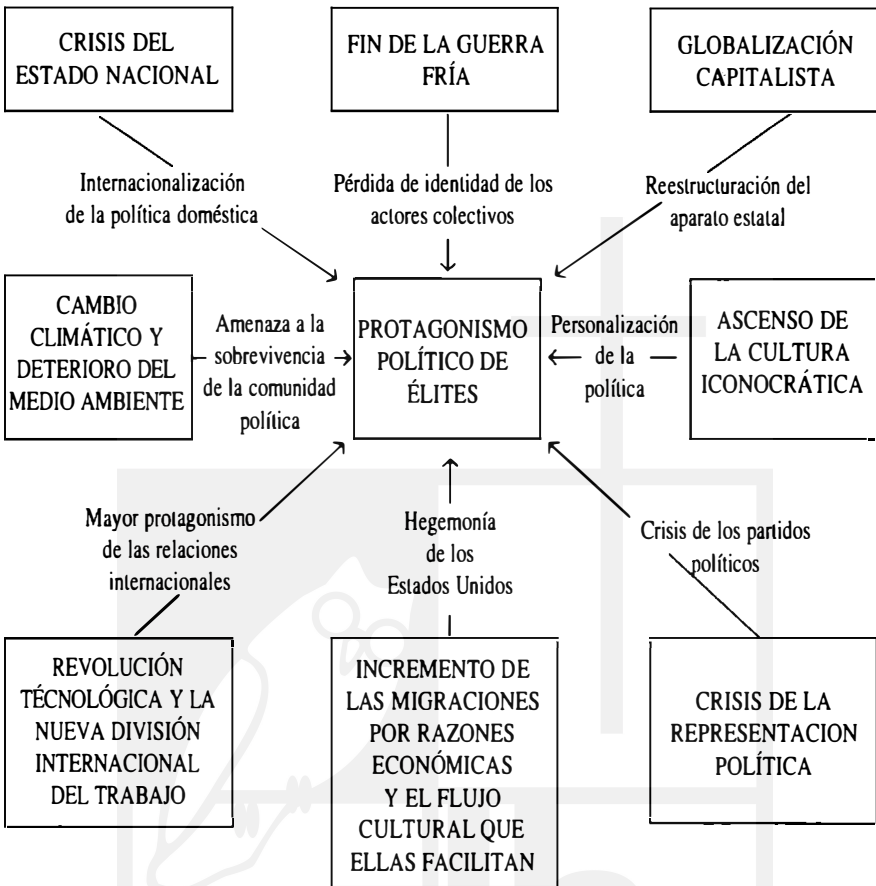
Figura 2 DIAGNÓSTICO POLÍTICO

En los debates legales y en las polémicas políticas abundan las referencias a la soberanía. Incluso llegó a utilizarse el tema de la soberanía para definir tipologías estatales. Así, por ejemplo, se llegó a hablar de estados centrales y periféricos, igualmente se habló de estados dependientes para identificar los estados cuyas decisiones vinculantes estaban en función del desarrollo de otros estados. Actualmente cada vez se habla más de estados interdependientes lo cual, desde mi punto de vista, no sería nada nuevo ni tendría por qué ser problemático. Tal vez reconocer que algunos estados pierden soberanía asuste cuando se trata de estados que durante muchos años fueron soberanos en gran medida. En el contexto de procesos de integración regional es comprensible que algunos estados europeos “tiemblen” ante el traspaso de competencias a instituciones suprana-