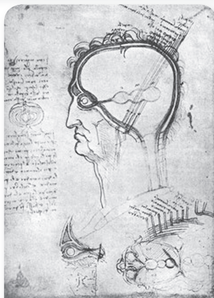
Figure 2. Drawing by Leonardo DaVinci of the projection of the eyes to the ventricles of the brain. From Polyak (1957).

ABSTRACT: If during 20th century genetics turned into the "star-science" par excellence, it is not a risk to state that, in the current century, neurosciences have the pretension to turn into the sciences of the future, aimed to decipher the most important continent to explore: The human brain. This paper analyses the relations between neurosciences and ethics. It is very transcendental issue, given the importance of ethics for human being but also given its epistemological and ideological consequences.