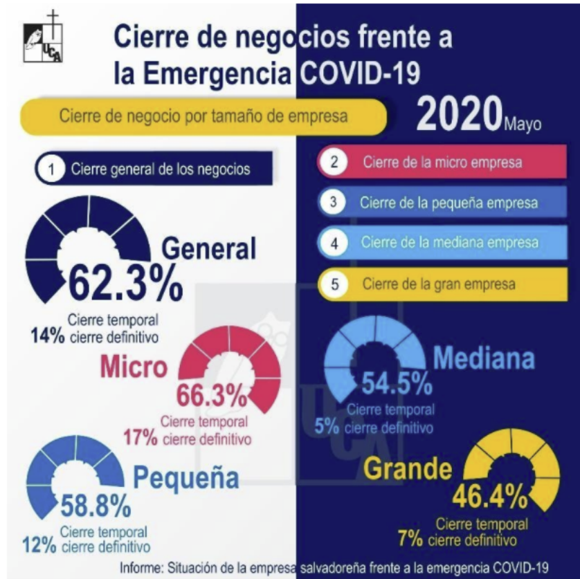
Ilustración SEQ Ilustración \* ARABIC 4. Cierre de negocios frente a la emergencia COVID-19.