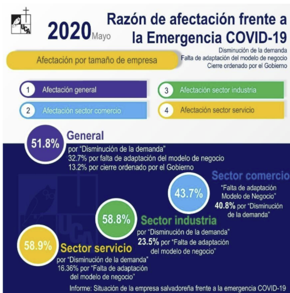
Ilustración SEQ Ilustración \* ARABIC 3. Razón de afectación por sector empresarial.