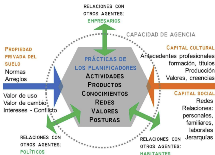
Figura 1: La configuración de las prácticas de los planificadores

Desde un punto de vista epistemológico, el trabajo requiere problematizar las relaciones entre cuatro conceptos fundamentales: el campo de la planificación territorial; el papel del agente planificador y su capacidad de agencia; la propiedad privada del suelo y la práctica profesional de los planificadores que se entiende como la combinación de productos y actividades, intenciones y formas de hacer, como se muestra en la figura 1.