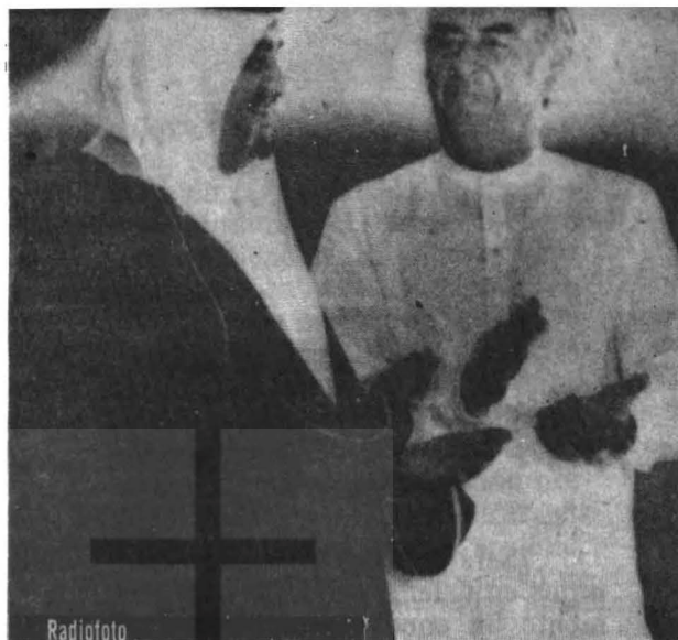
FAHD EN CANCUN. Cancún, México, octubre 22. El príncipe Fahd de Arabia Saudita y el presidente mexicano José López Portillo (derecha), aplauden cuando el primero llegó al aeropuerto de Cancún, para participar en la conferencia Norte-Sur que se inicia hoy en este balneario. La mayoría de estadistas llegaron ayer y hoy para asistir a ese cónclave mundial.

La reunión de Cancún se inicia con la representación de ocho delegados de los países industrializados y catorce líderes de los países en desarrollo. La alocución introductoria estuvo a cargo del Presidente anfitrión, López Portillo, quien puso de entrada sobre el tapete el enfoque del Tercer Mundo acerca de estos problemas económicos. El Presidente de México vino a decir que los países pobres y ricos deben hacer un esfuerzo consciente para cambiar la desigualdad y la injusticia del actual sistema económico internacional, que ha dejado a gran parte del planeta con hambre, pobreza y angustia. Sería dañino limitarse en estos encuentros a cambiar