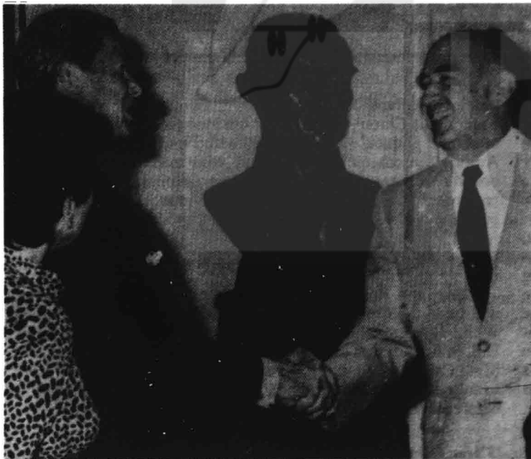
López Portillo, de México, saluda al Presidente Reagan de EE.UU.

Centro América fue otro de los ausentes; quizás por ello nuestros diarios guardaron un prudente silencio una vez terminada