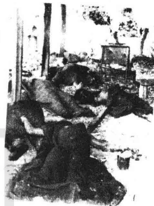
■ Más y más muertes.

3.000 hombres del ejército hondureño a zonas de El Salvador para combatir a la guerrilla. Una serie de pasos previos a la intervención de este país.