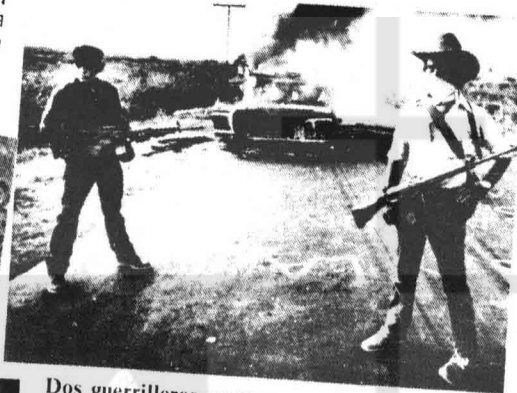
■ Dos guerrilleros montan guardia después de haber quemado un camión gubernamental.

Mientras se suceden las referencias al fantasma de Vietnam y senadores demócratas y republicanos norteamericanos ponen en duda la política de su Gobierno respecto a El Salvador, la Administración Reagan piensa duplicar la ayuda bélica a este país.